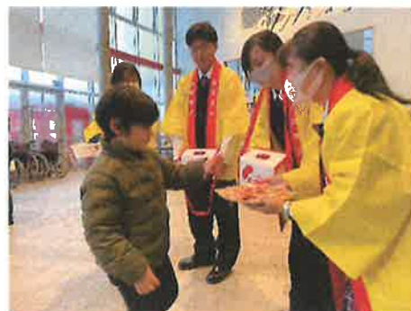
『赤い羽根共同募金の街頭募金』