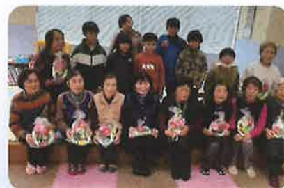
◀ 中屋敷区サロンの皆さんと大川児童クラブとの交流会