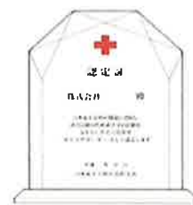
赤十字サポーター認定証 (クリスタル製)

【お問い合わせ先】日本赤十字社阿久根市支部（阿久根市社会福祉協議会内）☎72-3800