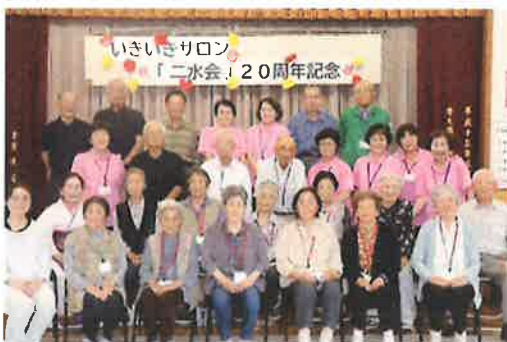
『昨年20周年を迎えた牛之浜区二水会』