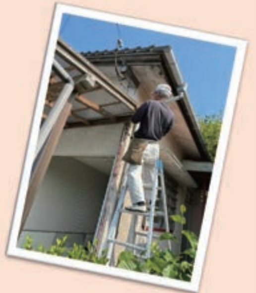
有償ボランティア『ちょこっと世話やき隊』の隊員さんによる支援活動の様子