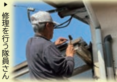
▶ 修理を行う隊員さん

また、大工経験のある隊員さんがガレージの屋根の修理をしてくださいました。(表紙掲載)