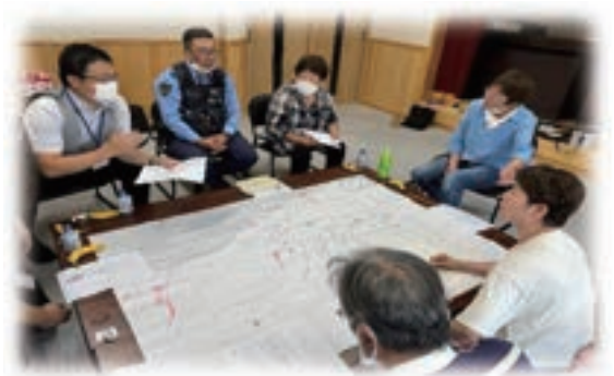
▲ 尻無区(鈴木段)でのマップづくりの様子

自分の地域でもマップづくりしたいという方は、阿久根市社会福祉協議会(☎72-3800)まで。