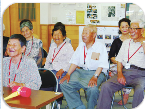
牛之浜区サロンの皆さん (平成25年度)