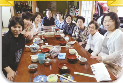
遠見ヶ丘区サロンの皆さん