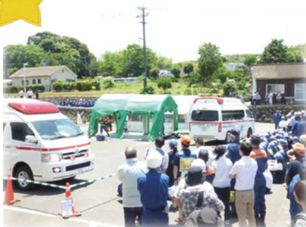
たくさんの方が集まりました