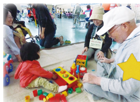
ちびっ子広場コーナー