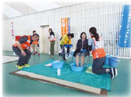
被災した方のための足湯コーナー