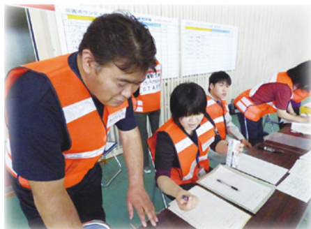
ボランティアの役割分担を決める様子