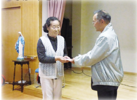
2015ネパール地震救援金