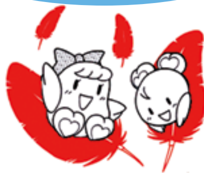
鹿児島県共同募金委員会

鹿児島県共同募金委員会が鹿児島県内の各市町村からの募金をまとめ、各市町村へ公平に分配します