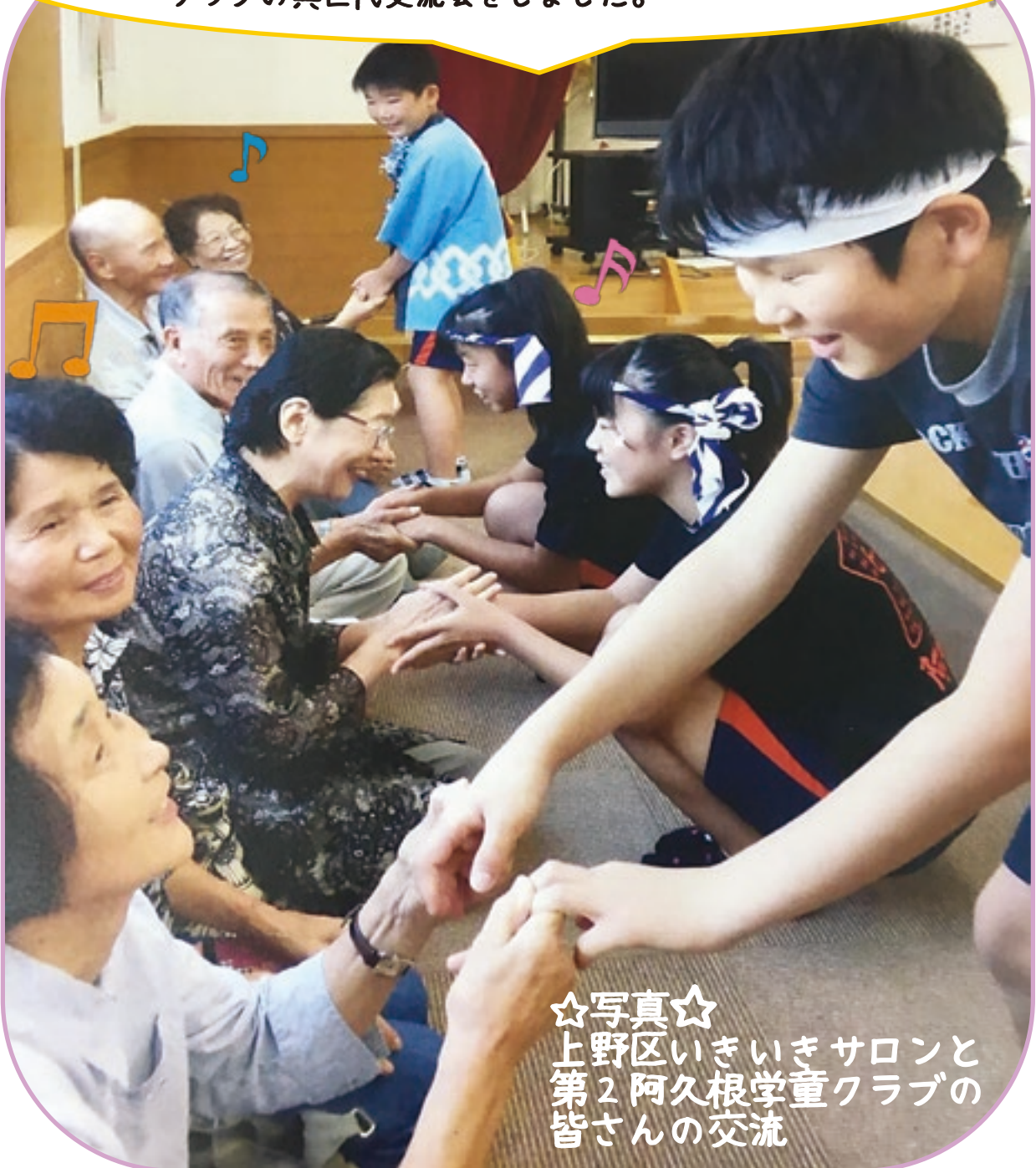
☆写真☆ 上野区いきいきサロンと 第2阿久根学童クラブの 皆さんの交流

この広報誌は共同基金会からの配分金で作成しています。 今年度の赤い羽根共同基金の運動についてのお知らせは、 2～3ページ目をご覧ください。