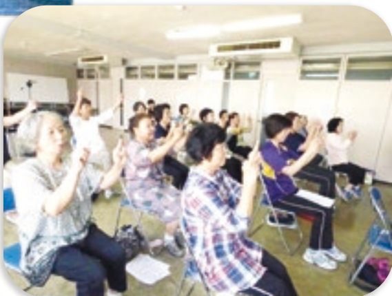
レクリエーションの練習♪