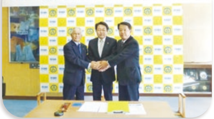
地域における見守り活動に関する協力協定締結式

【唱】猫の手もち言が頼んみやんせ 街の青年 手伝どま不要ん 収穫期 内田辰丸 【唱】帰つ時きや 沢山積んだ車 豊作田 孫も帰省い 手伝貰ろつ 宮原若女 【唱】手伝の予定が邪魔どまなつて 台風来つ 屋根葺つ大工の 手伝をすつ 池上博士 【唱】機嫌ぬ取いと 婆ん方が利口か 宿ん孫 何によ手伝してん 利口なこつ 林田クイーン 【唱】辞典ぬ買つち言て 婆を騙けつ 脛かじい 小遣け欲せな 手伝励つ 大田盛そば 【唱】仕事ちや大概てげ 食事が先じやろ 引越の 蕎麦を目当い 手伝をしつ 林田夜醉 【唱】猫も膝せ来て 軒くかつが 田舎店 婆は手伝番で 居眠を漕つ 斉藤バリカン 【唱】油が飛つてち 焦つから揚げ 母親料理 幼児も手伝すち 裾せ纏付つ 太田土管 【唱】茶髪の頭が 少す目立つど 通夜ん手伝 受け立った 神妙面 新福神舞