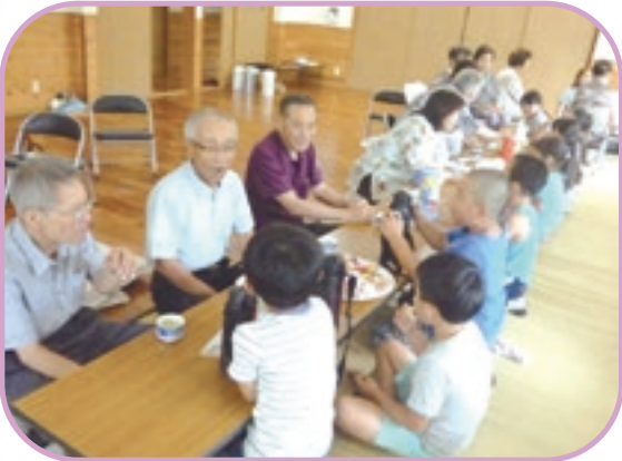
山下長寿会と山下児童クラブの皆さん