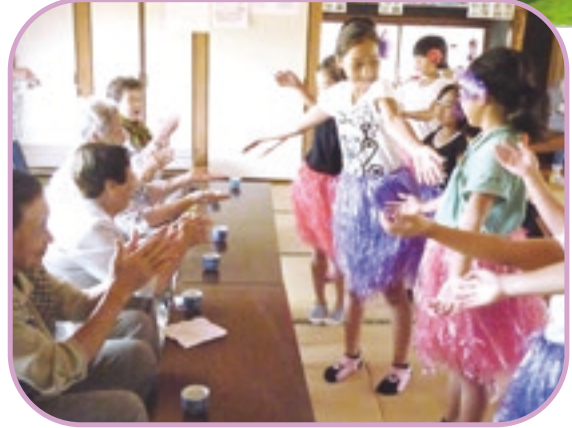
下村区サロンと脇本児童クラブの皆さん