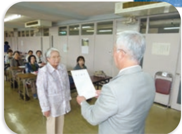
修了おめでとうございます！

「ふれあいいきいきサロン」とは、ひとり暮らしや、家の中で過ごしがちな高齢者と地域住民が集い、食事やお茶をとりながらレクリエーション、おしゃべり、ゲームや体操などを「気軽に」「無理なく」「楽しく」過ごせる時間です。