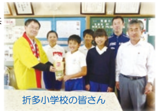
折多小学校の皆さん

皆様からの善意は地域の福祉のために使わせていただきます。 ありがとうございます。