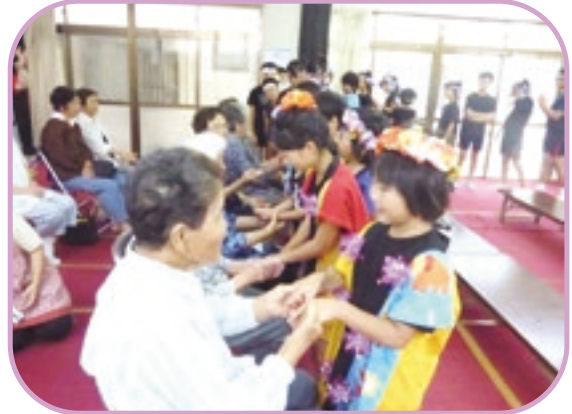
新町区サロンと第2阿久根学童クラブの皆さん