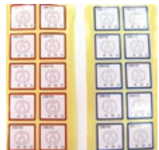
ポイントシールの見本

(ポイントが20ポイントに満たない・交換時期を過ぎた等の理由で商品券へ交換できなかった方も含みます。商品券へ交換できなかったポイントについては、10ポイントを上限とし、翌年度に繰り越すことが出来ます)