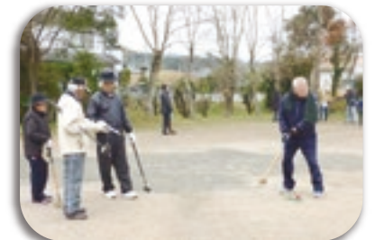
写真：身体障害者福祉協議会 グラウンドゴルフ大会