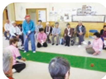
↑いきいきサロンの様子