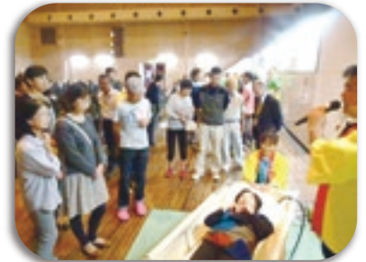
写真：訪問入浴の利用方法を 手をつなぐ育成まつりで紹介