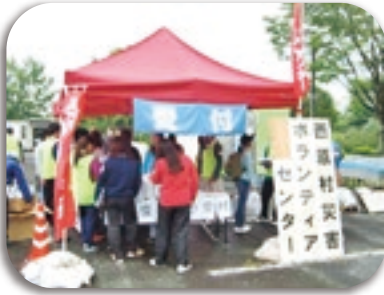
写真：平成28年熊本地震災害への ボランティア派遣