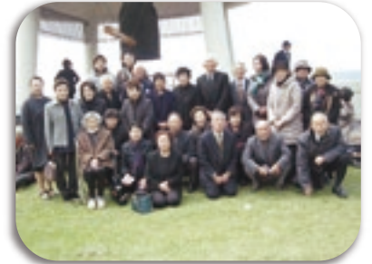
写真：阿久根市遺族会 比島方面慰霊祭