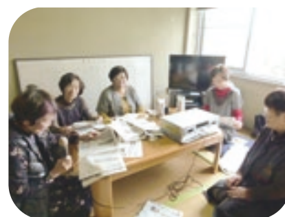
↑朗読ボランティアの様子