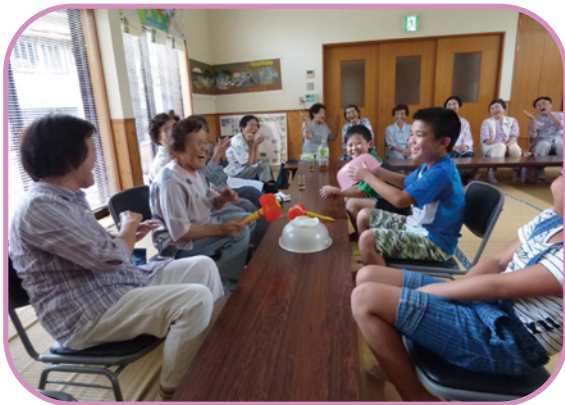
いきいきサロンの異世代交流