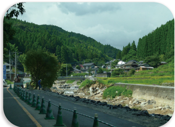
東峰村の被害の状況

7月5日から九州北部を中心に断続的に発生した大雨災害により、福岡県の東峰村・朝倉市に大きな被害がもたらされました。