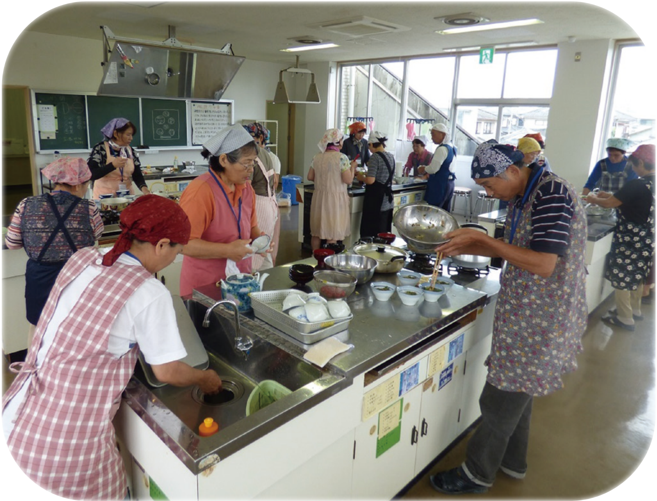
写真↑ 8月～9月に実施された高齢者生活支援サポーター養成講座の様子です。調理実習などの講習を通して、地域での福祉活動をするサポーターを養成しました。この養成講座の開催にも共同募金が役立てられています。

この広報誌は共同募金会からの配分金で作成 しています。 今年度の赤い羽根共同募金の運動について のお知らせは、2～3ページ目をご覧ください。