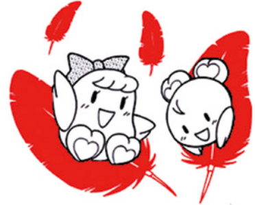
鹿児島県共同募金委員会