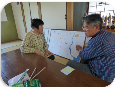
下村区での見直しの様子

支え合いマップは、地域にどんな人たちが住んでいて、どんなことに困っているか等を地図に落とし込み、まとめたものです。