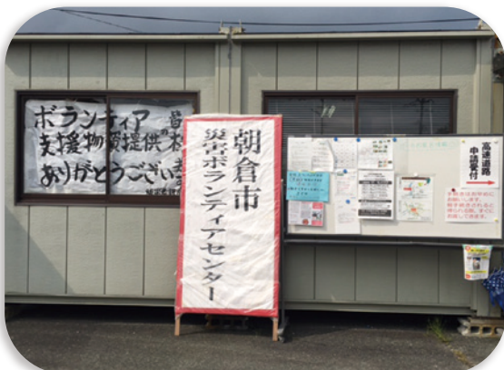
朝倉市の災害ボランティアセンター