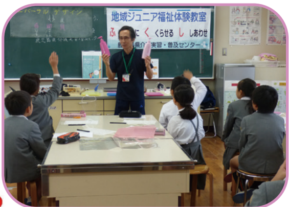
小学校の福祉体験学習