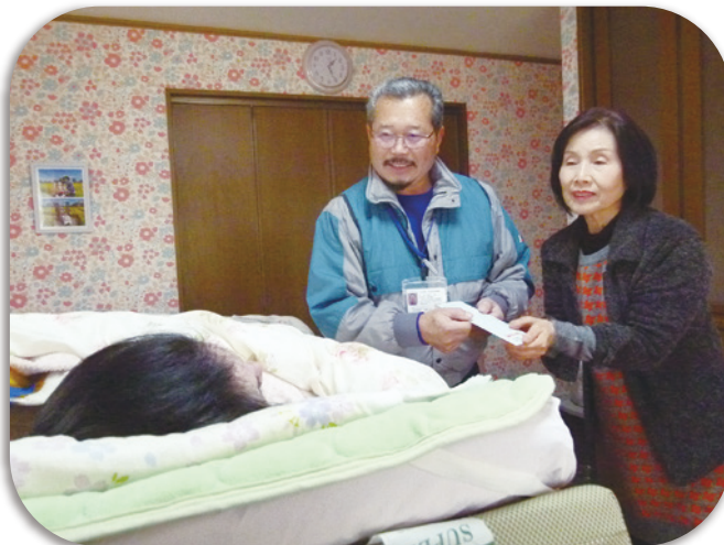
民生委員さんがお見舞い金をお届けされました

民生委員児童委員の方々には「今年もまたお見舞い金をお渡しすることが出来て、地域の方が安心して年始を迎えられます。」と市民の皆さまの善意に感謝されていました。