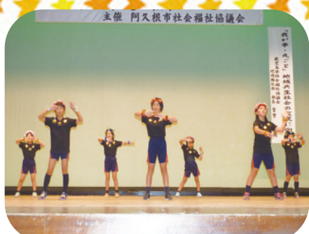
阿久根学童クラブの「恋ダンス」

「福祉のつどい」は、地域福祉の啓蒙啓発とボランティア活動の推進を図るため毎年開催されています。