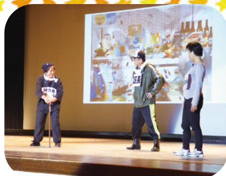
寸劇「いつまでも地域で暮らすには」