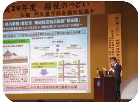
県内における福祉の事例発表