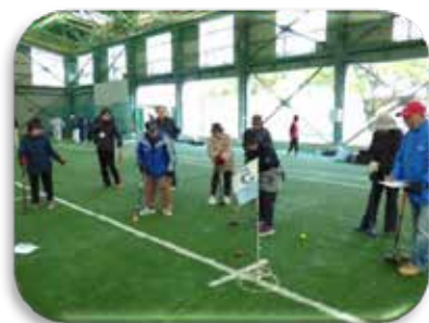
写真：阿久根市身体障害者福祉協議会 グラウンドゴルフ大会

これらのことを十分にご理解いただいた上、会員登録にご協力くださいますよう、よろしく願い申し上げます。