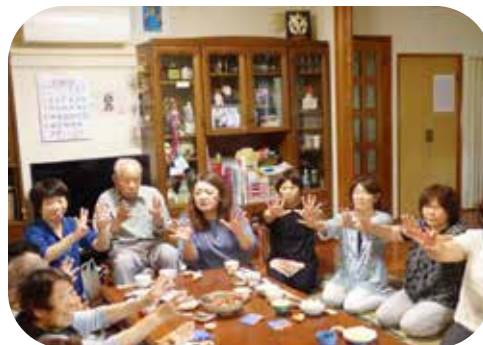
遠見ヶ岡区いきいきサロンの活動