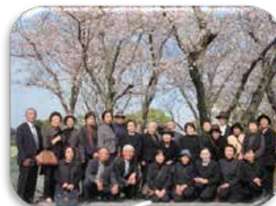
写真：阿久根市遺族会 比島方面慰霊祭