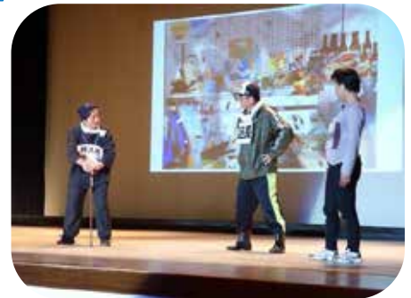
写真：「福祉のつどい」の寸劇 「いつまでも地域で暮らすには」