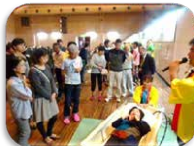
写真：訪問入浴の利用方法を紹介