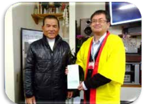
写真：赤い羽根共同募金活動