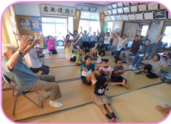
いきいきサロンの異世代交流