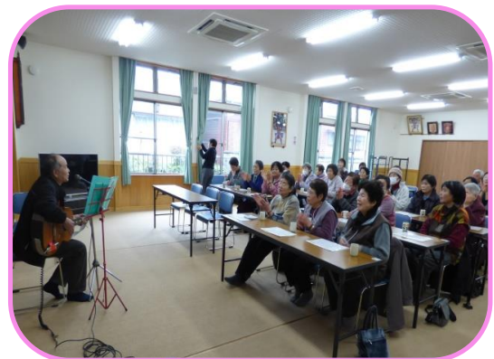
ボランティア活動(弾き語り)