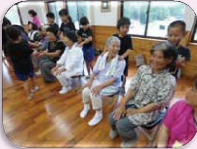
学童クラブと異世代交流

「誰もが安心して地域で 暮らせる福祉のまちづく り」の理念のもと、公助、 共助、互助、自助の充実 を図りながら、ボランテ ィアセンター、生活相談 支援センターの充実、さ らには、市からの委託事 業「地域における共助の 基盤づくり事業」や、「高 齢者元気度アップ・ポイ ント事業」、「生活支援