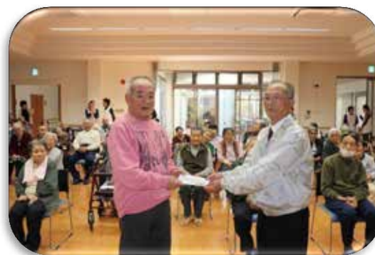
↑聖園老人ホーム利用者・職員一同様

①～④を阿久根市社会福祉協議会にて受付中です。 皆様からお寄せいただいた義援金は、日本赤十字社を通じて被災地へ全額送金しています。 ご希望の方には領収証の発行をいたしますので窓口にお知らせください。