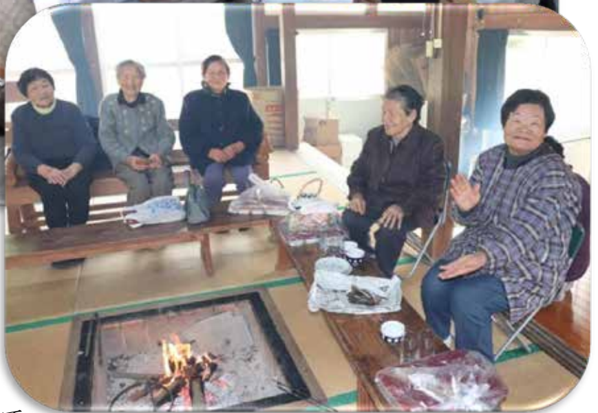
↑ 尻無区南畑地区サロン