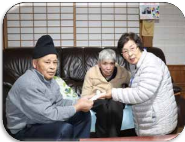
民生委員さんがお見舞い金をお届けしている様子

民生委員児童委員の方々は「今年もまたお見舞い金をお渡しすることが出来て、地域の方が安心して年始を迎えられます。」と市民の皆さまの善意に感謝されていました。