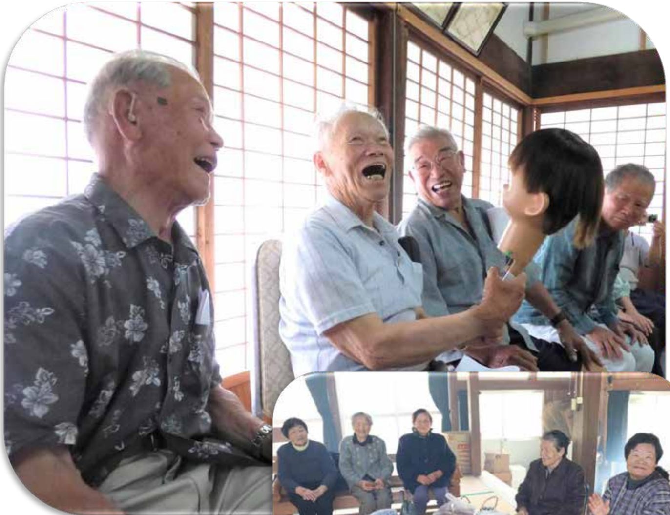
↑ 桑原城上区サロン