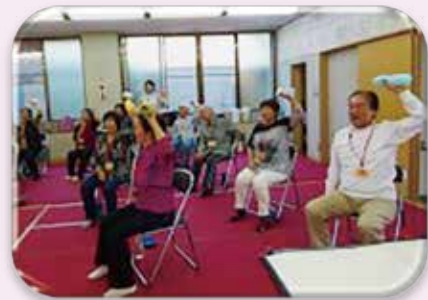
高齢者元気度アップ・ポイント事業対象 (ころばん体操)

コーディネート事業」 などを推進しながら、地 域包括支援センターの介 護予防「ころばん体操」 など、福祉事務所や関係 機関と緊密に連携しなが ら、地域の実情に則した 事業の展開を推進して参 りたいと考えているとこ ろであります。