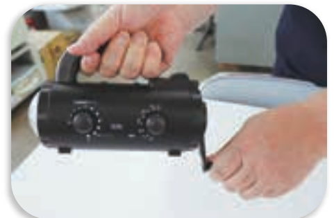
多機能ライト（手回し充電式）