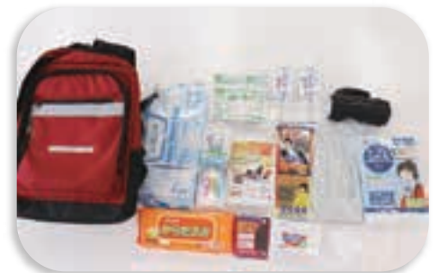
防災リュックの中身の一例

※水については、「1日につき成人1人あたり概ね3リットルが必要」と言われますが、荷物が重くなって避難に支障が出ないように、持てる量を用意し、給水車等が来た際スムーズに給水できるよう容器の準備をおすすめします。