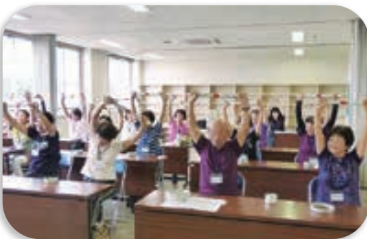
過年度の養成講座