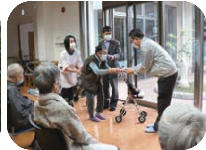
聖園老人ホームの皆様