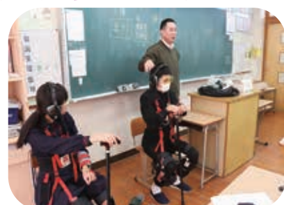
阿久根中学校の高齢者疑似体験