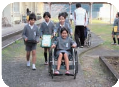
脇本小学校の福祉体験学習