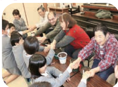
脇本小学校と脇本馬場区サロンの交流