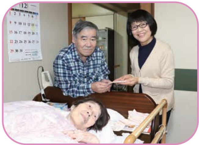
民生委員さんがお見舞い金をお届けされました

民生委員児童委員の方々は「今年もまたお見舞い金をお渡しすることが出来て、地域の方が安心して年始を迎えられます。」と市民の皆様の善意に感謝されていました。