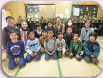
「めだかの学校」とお正月の フラワーアレンジメント

旧年中は、平成から令和へ、新天皇の即位慶賀をはじめ、政治、経済、スポーツ、その他の分野においても、大きな変革と躍進を感じた年でありました。また、佐賀県の令和元年8月豪雨災害をはじめ台風15号・19号による災害等、大規模な自然災害が発生しましたが、本会の日本赤十字社の義援金活動に、沢山の市民の皆様のご協力のおかげをいただきました。このように、他にも赤い羽根