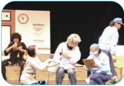
阿久根市消防団女性消防隊による寸劇 「んだもしたん。あら、まあ大変」