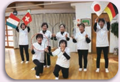
「おひさま」による施設ボランティア

共同募金活動や、災害ボランティア活動などに対する理解や実践などが、年々広がってきているようであります。今年も、全国的に進行する人口減少や少子高齢化の中でも、医療、保健、福祉、介護が連携をとりながら、「誰もが安心して地域で暮らせる福祉のまちづくり」を目指して、事業を推進してまいりたいと考えております。