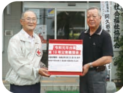
潟区大運動会の義援金

皆様からお寄せいただいた義援金は、日本赤十字社鹿児島県支部を通じて、被災地へ全額送金しています。ご希望の方に領収証を発行いたします。なお、③は阿久根市役所、三笠支所、大川出張所の窓口でも受け付けています。