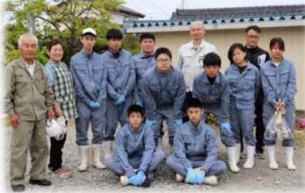
段区の方々と鶴翔高校農業科2年生のみなさん