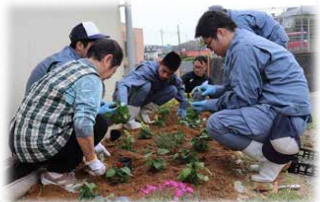
サルビアとマリーゴールドを植えました