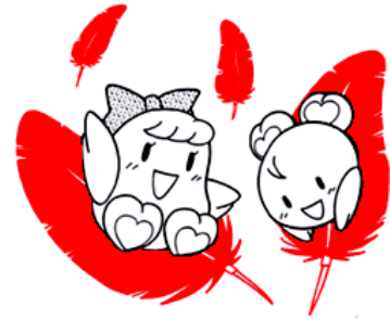
鹿児島県共同募金委員会