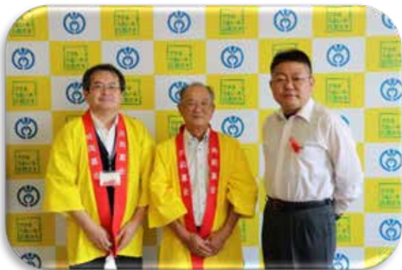
「阿久根市長へ表敬訪問の様子」