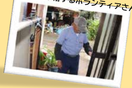
声かけ見守りをするボランティアさん