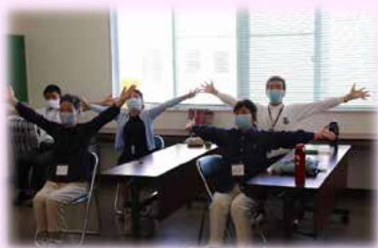
ボランティアグループ養成講座

感染予防対策として3密「密集・密接・密閉」の回避が最も有効策とされ、昨年の世相を一字で表す漢字は「密」でありました。