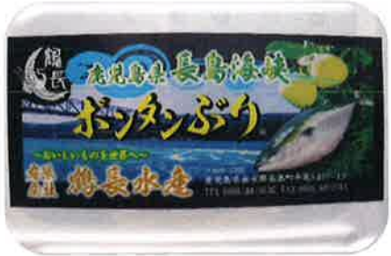
▲北さつま漁協様より

9月17日、あかいご食堂（赤瀬川地区）さんへ食材提供がありました。マルイ農協グループ様からは、当初より肉や卵、加工食品の提供をいただいております。この度北さつま漁協様より、「ボンタンぶり」をいただきました。阿久根のボンタンを餌に混ぜ合わせ生育したぶりは、臭みがなく身もふっくらとしていて、とても美味しく、地域の方々からも大好評でした。「このような食材支援、地域の方々のおかげで活動が成り立っています。本当に感謝です。」との、ボランティアの方々からの声でした。