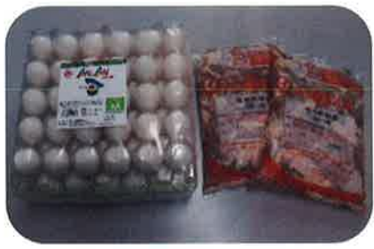
▲マルイ農協グループ様より