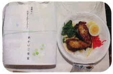
▲あかいご食堂「ぶりの照り焼き丼」