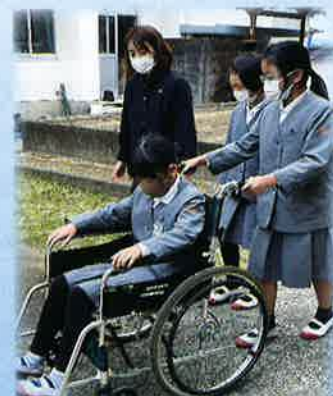
▲ 車椅子体験の様子