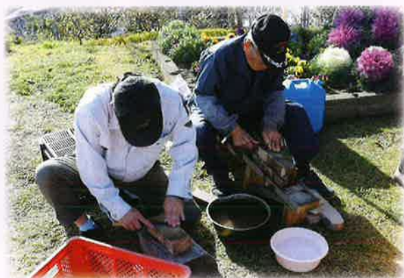
ちよこつと世話やき隊による

本市の高齢者を取り巻く環境は、高齢化率約42%、独居高齢者2,878世帯と高い高齢化社会となっております。高齢者