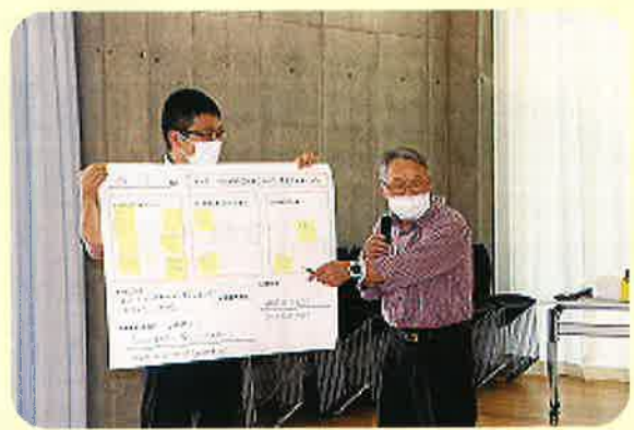
▲ グループ発表の様子

また、鹿児島県内の市町村でも有償ボランティアは数多くあります。独居や高齢者世帯が増え、生活していく上で、出来ないこと、困ったことが出てきたからと言って、施設や公的サービスだけに頼るのではなく、少しの手助けがあれば、慣れ親しんだ地域でこれまで通り生活できるよう、他の市町村の方々もいろんなことを考えて活動を行っている