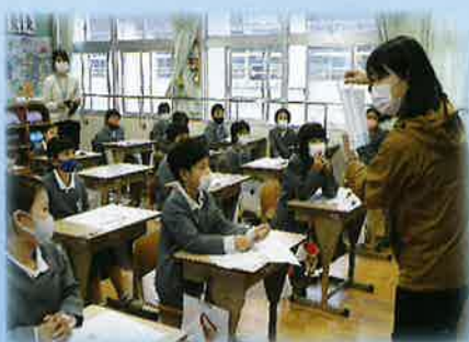
▲「福祉ってなんだろう?」の学びの様子

始めに児童たちには、普段の暮らしの中で、支えを必要としている人たちに対して、現在の社会で工夫されていることや、考えられていることを学んでもらいました。次に、実際にアイマスク・白杖・車椅子を使用し疑似体験することで、『自分なら何ができるか?』『行動していくために何が必要なのか?』を、学んでいただきました。子供たちからは、「いつもいる学校なのに目が見えないと怖かった」「困っている人がいたら声をかけてみようと思う」との声がありました。このように、阿久根市社会福祉協議会では「福祉体験学習をしてみたい!」という学校・団体・個人の方がいらっしゃいましたら、職員が学習のお手伝いをします。その際は、 阿久根市社会福祉協議会 地域福祉係 電話 72-3800 までお問い合わせください。