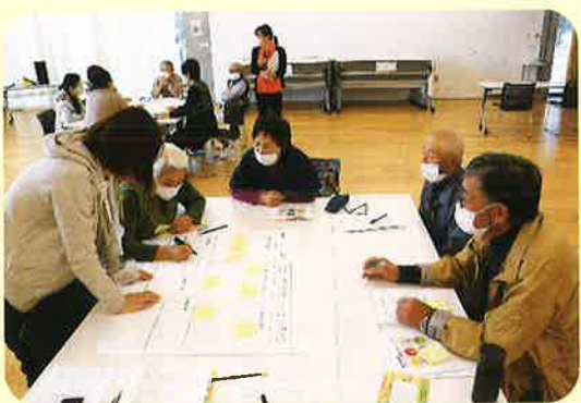
▶ グループワークの様子

事業説明にて、活動のルールや活動の方法を皆さんと確認し、これまでの活動事例を報告しました。活動依頼数は二十件で、草刈りや草取りの依頼が多く、最近では「ミ出し」に関する相談も増えてきている状況です。