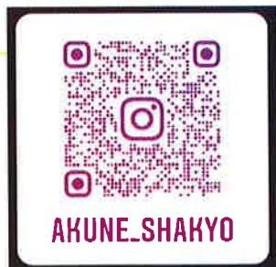
▲ 阿久根市社協 QR コード