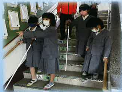
▲ 白杖の体験の様子