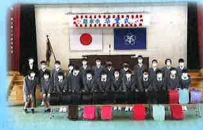
▲昨年のランドセル寄贈式の様子