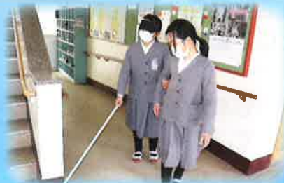
▲白杖の体験の様子