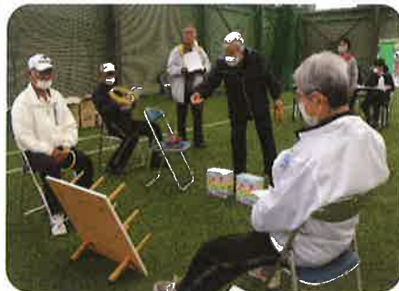
▲ 輪投げ大会の様子

11月15日阿久根市身体障害者福祉協議会の輪投げ大会を屋内運動場にて行いました。「輪で話と和を」を合言葉に、皆さんで幼い頃誰もが親しんだ輪投げを楽しみました。