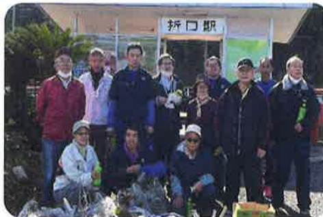
▲ 阿久根市身体障害者福祉協議会・デイハウスふたばのみなさん

12月6日折口駅周辺にて、清掃ボランティアを行いました。寒い日ではありましたが、天候も良く皆さんのおかげで、折口駅がきれいになりました。