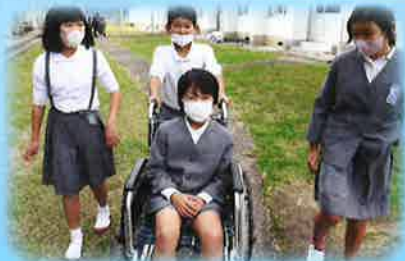
▲車椅子体験の様子

回収場所は、 阿久根市社会福祉協議会 または、 脇本小学校 までご持参ください。