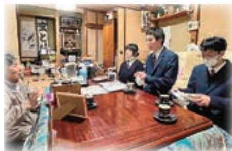
▲ 地域の方との会話を楽しむ