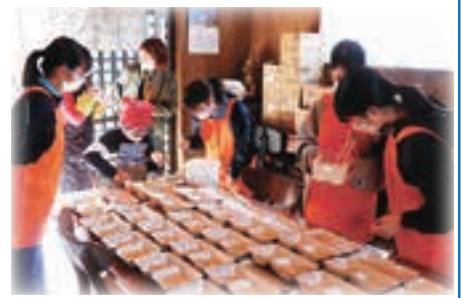
▲ ちいき食堂ボランティア