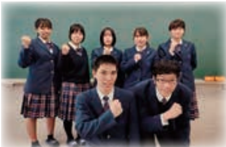
▲ kindness の皆さん

昨年10月、地域に根差したボランティア活動を目指して、高齢者疑似体験などの『ボランティアきっかけ講座』を行い、その後みんなで話し合いや、地域の高齢者の方から普段の様子を直接聞き取るなどして、3月、ボランティアグループ『kindness (カインドネス)』を結成しました。Kindnessとは、「やさしさ」や「親切」という意味が込められています。「あまり大きなことは言えませんが、地域の方々の困りごとに、少しでも力になればいいです」と話してくれた姿がとても印象的でした。