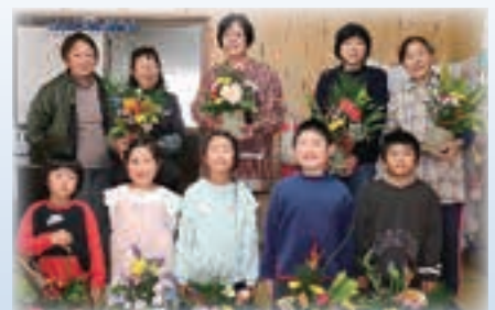
▲子育て支援『めだかの学校』のみなさんと山下学童の子ども達