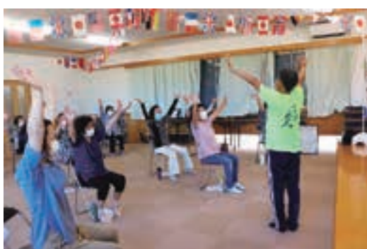
『浦区いきいきサロンの様子(笑いヨガ)』