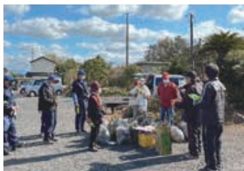
『障害者団体合同清掃ボランティア』