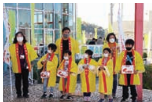
『赤い羽根共同募金の街頭募金』