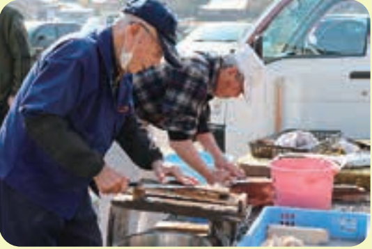
▶ 高之口区刃物研ぎ