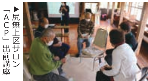
▶尻無上区サロン「ACP」出前講座