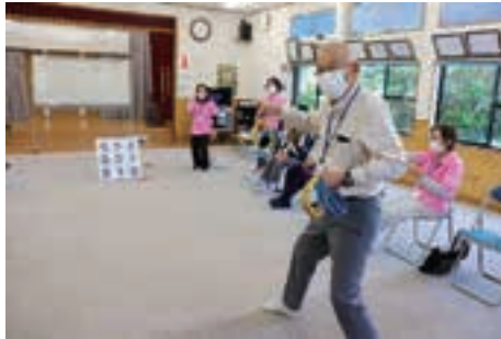
▲牛之浜区「輪投げ」でゲーム大会