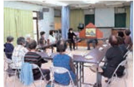
▶新町区サロン「紙芝居」読み聞かせ