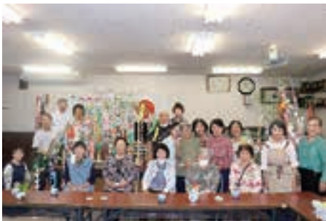
▲段区「七夕かざり」制作