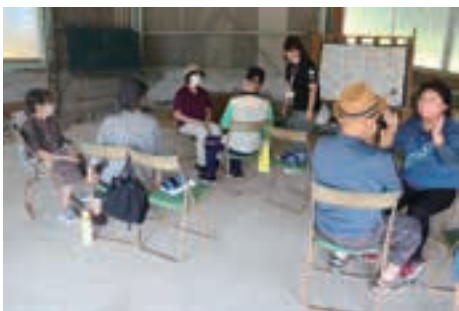
▲桐野下区サロン新規立ち上げ