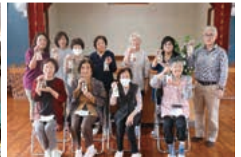
▲大丸区「炊き出し訓練」