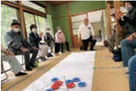
▲大漣区「カーリング」でゲーム

このように、阿久根市社会福祉協議会では、ふれあいいきいきサロンの立ち上げサポートをしています。お気軽にご相談ください。