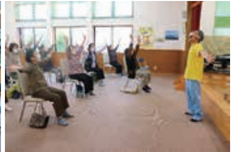
▲上野区「笑いヨガ」講師