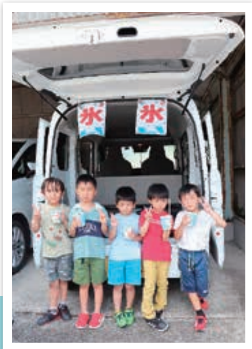
人気の味はコーラ味でした！