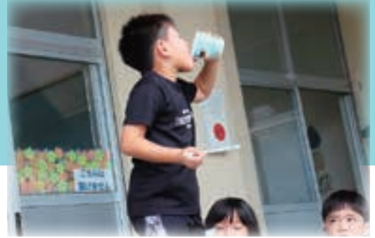
カキ氷おじさん現る！