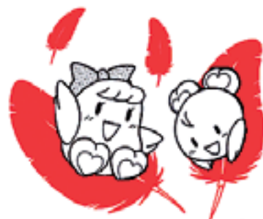
鹿児島県共同募金会